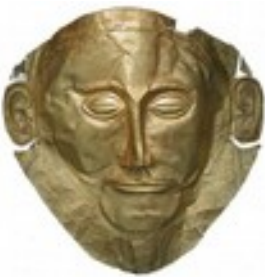
Masque en Or dit masque d'Agamemnon, -1600 -1500 av J.C Mycenes, H. 0.315

Objets de dévotion, objets de rites, traditions populaires, et toute sorte d'objets... objets à soi...