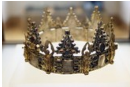
Couronne reliquaire dite Couronne de Liège. Musée du Louvre