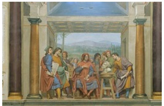
Jean Antoine WATTEAU L'Enseigne de Gersaint , 1721

Les critères de choix des collections sont la valeur des objets réunis, soit par leur prestige, soit par leur rareté ou par leur seul aspect curieux aussi.