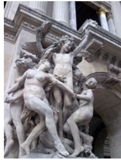
ERNEST PIGNON ERNEST David et Goliath , La Danse sur le fronton de l'Opéra Garnier, 1985-1989