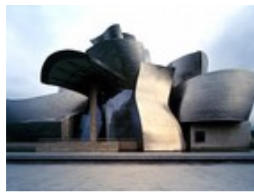
Frank O. GEHRY Musée Guggenheim Bilbao , 1997