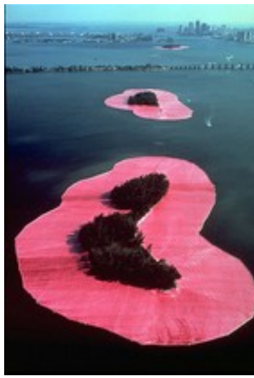
Daniel BUREN 50 travaux environ New York , 1970