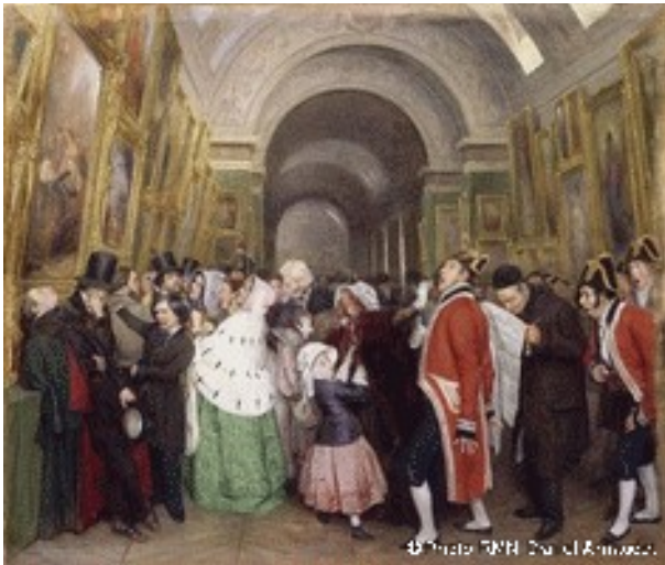
François Auguste BIARD Quatre heures au Salon , 1847 ( Fermeture du Salon annuel de peinture dans la Grande Galerie du Louvre )

Depuis l'Antiquité, les artistes montrent leurs œuvres mais l'origine de l'exposition est dans les salons organisés à partir de 1667, pour ses membres, par l'Académie royale de peinture et de sculpture, dans le salon carré du Louvre