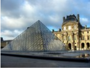
de Ieoh Ming PEI Pyramide , 1989 Cour Napoléon du Louvre

Ils occupent des bâtiments du patrimoine historique - le Palais du Louvre,- ou industriel, faisant l'objet de réhabilitation, comme le musée d'Orsay - une ancienne gare parisienne- D'autres sont construits pour répondre à ce seul programme de muséographie