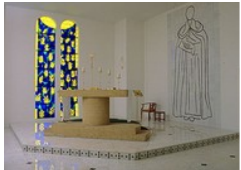
Chapelle des Dominicains (1951) - dite du Rosaire ou de MATISSE (1869-1954) Vence, Alpes-Maritimes