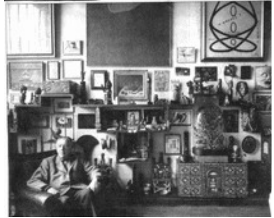
André BRETON dans son bureau, Photographié pour la revue l'Œil