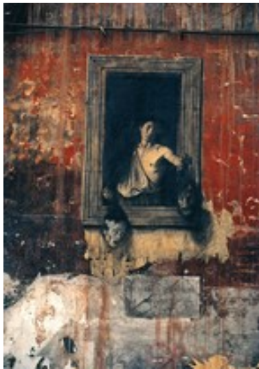
1990 Peter STÄMPFLI, Empreinte de pneu S155 , réunissant les têtes tranchées de CARAVAGE et PASOLINI, 1964. Paris Naples intervention (sérigraphies collées)

peut aussi être investi comme lieu de présentation d'œuvres d'art, par la statuaire monumentale notamment, mais pas seulement