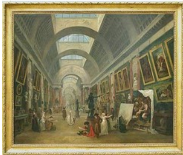
Hubert ROBERT Projet d'aménagement de la Grande salle du Louvre , 1796

Les musées, les fonds et centres d'art contemporain rassemblent des collections permanentes et sont aussi le lieu d'expositions temporaires , comme pour les grandes manifestations internationales que sont les Biennales (de Lyon, de Venise, d'Athènes...). Le marché de l'art s'organise dans le circuit des galeries d'art, et lors de Foires internationales d'art contemporain (FIAC).