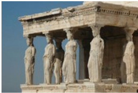
Parthénon, les Caryatides Athènes -447, -432 av.JC.

Les églises, les monastères, rassemblent aussi des trésors constitués d'objets utilisés pour le culte, de sculptures, vitraux et tableaux illustrant la vie des Saints, en accompagnement des liturgies. C'est le rôle des retables placés devant l'autel, et des vitraux.