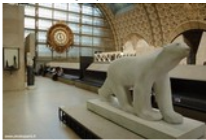
Gae AULENTI, intérieur du Musée d'Orsay restructuré, 1986