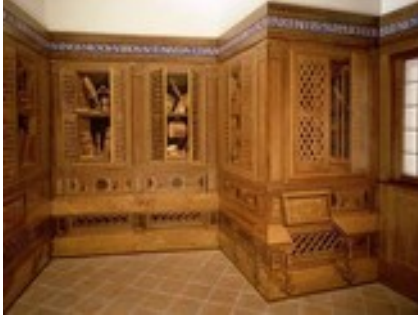
Studiolo du duc de Montefeltro, Palais Ducale, URBINO - détail des marqueteries

C'est avec les cabinets de curiosités qui rassemblaient les choses naturelles propres à étonner et des objets rares, précieux, exotiques parfois que naissent les premiers musées , au XVI ème s.