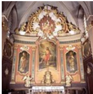
Retable de Pesmes