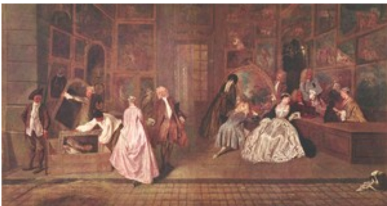
Ottavio VANINI Laurent de Médicis avec des artistes et des vertus , 1635

Le nom de « musée » est déjà donné aux collections des Médicis, à Florence