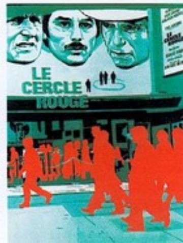
Gérard FROMANGER, (1939), Le cercle rouge , 1971, huile sur toile 130 x 97 cm, Musée de Dole.