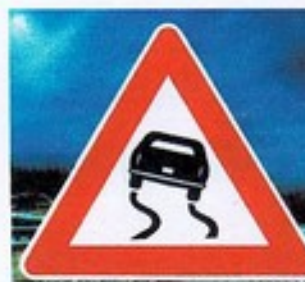
Panneau de signalisation Photographie

Les feux de signalisation sont les mêmes dans le monde entier et nous indiquent ce qu'il faut faire. Les panneaux de sécurité routière également. Le triangle rouge indique un danger et le dessin annonce une route glissante.