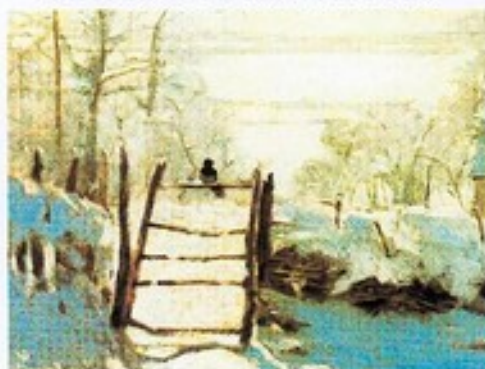
Claude MONET, la pie , 1868, détail, huile sur toile, 130 x 89 cm, Musée d'Orsay Paris.

Posées les unes à côté des autres, les couleurs s'influencent mutuellement et ressortent différemment. Dans le clair-obscur, les couleurs claires et les couleurs foncées créent un sentiment d'espace, de tridimensionalité. Les couleurs lumineuses semblent avancer, les froides ou sombres semblent reculer.