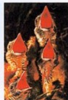
Osillons réclamant à manger photographie