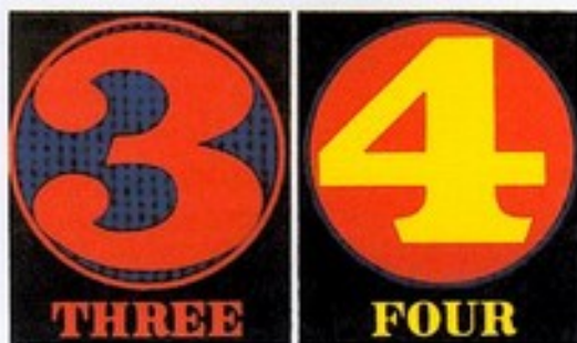
Robert INDIANA, Nombres de 0 à 9, détails 3 et 4, 1968.