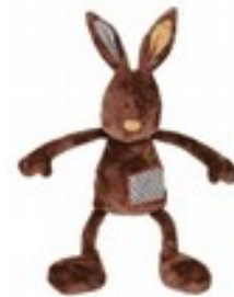
Doudou lapin (Habitat)