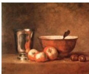
J. Vermeer (1632-1691) Nature morte au pot doré , Huile sur toile

L'œuvre est là unique, autonome, chef d'œuvre lorsqu'elle atteint un degré de perfection