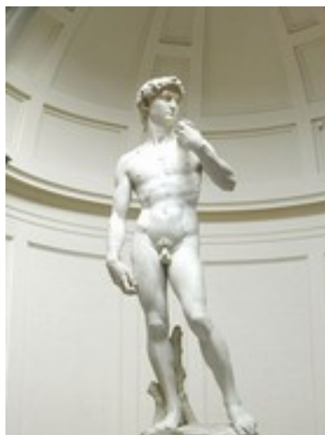
Michel-Ange (1475-1564) David 1501-1504.

L'œuvre abstraite ne dépeint pas les apparences visibles du monde réel, mais est objet réel né de l'imagination de l'artiste, à partir des moyens dont il dispose ; le matériau qu'il sculpte, la couleur dont il se sert à des fins d'expression pure