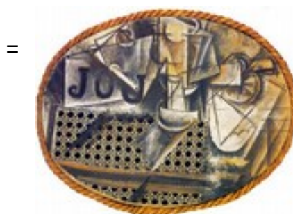
Pablo Picasso (1881-1973) Nature morte à la chaise cannée , Huile sur toile cirée, corde 29 x