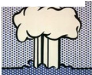
Roy LICHTENSTEIN, Atomic Landscape , 1966, acrylique sur toile.