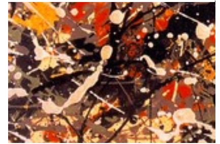
Jackson POLLOCK (1912-1956), T. Number 8 , détail, oil enlameand aluminium on canvas, State of University, New-York.