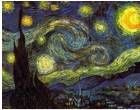
Vincent VAN GOGH (1853-1890), Nuit étoilée , 1889, Huile sur toile, Musée d'art moderne, New-York.