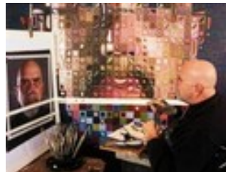
Chuck CLOSE, Work , 2008., photo extraite d'un ouvrage.