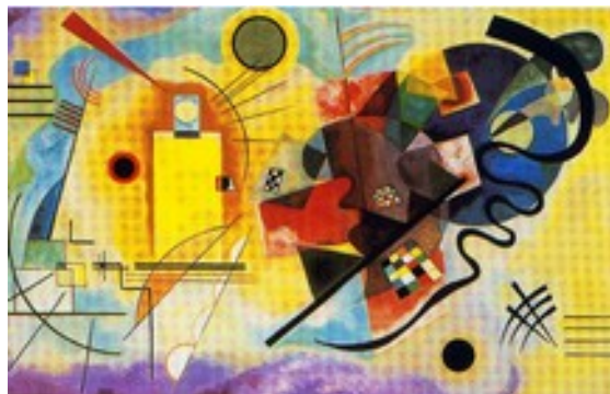
Wassily KANDINSKY (1866-1944), Jaune, rouge, bleu , 1925, aquarelle, 201x128 cm, CNAM, Beaubourg, Paris

Retrouve les différentes manières de peindre des artistes ci-dessus et place le terme au crayon à côté de l'œuvre (à la touche, au point, avec des aplats, des effets de transparences, de dégradés, de nuances, des effets numériques, des coulures, giclures ).