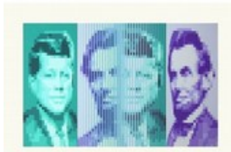
YVARAL ( Jean-Pierre VASARELY ) , 3 Présidents , Screenprint, 55x33 cm