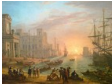
LE LORRAIN, Port de mer au soleil couchant , 1639, huile sur toile, 103x137cm, Musée du Louvre.