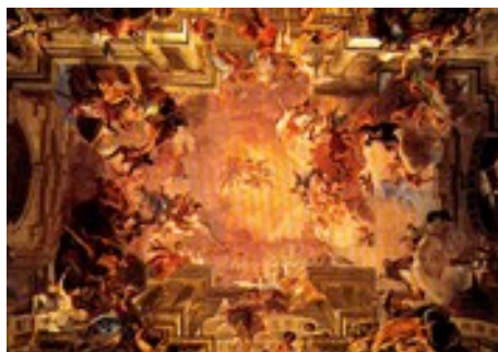
Andréa POZZO (1642-1709), fresque , 1685-1694, Voûte de la nef de St Ignace, Rome.