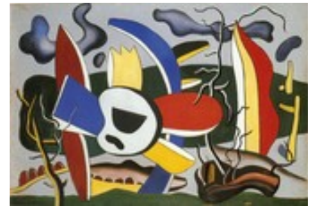
Fernand LEGER, Papillons et fleurs , 1937, huile sur toile, 89x130 cm.