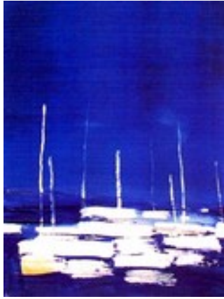
Nicolas de STAËL (1914-1955) Voiliers à Antibes , huile sur toile.