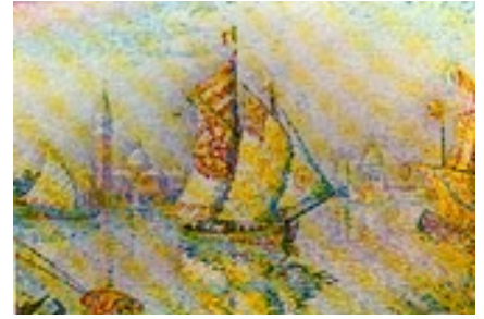
Paul SIGNAC (1863-1935), La voile jaune , 1904, huile sur toile, 72 x 91 cm, Musée de Besançon.