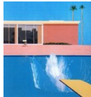
David HOCKNEY (1987), A bigger splash , 1967, acrylique sur toile, 243x243 cm, Tate Gallery Londres.