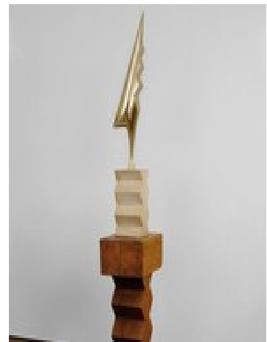
Constantin BRANCUSI, sans titre , après 1935, Le coq