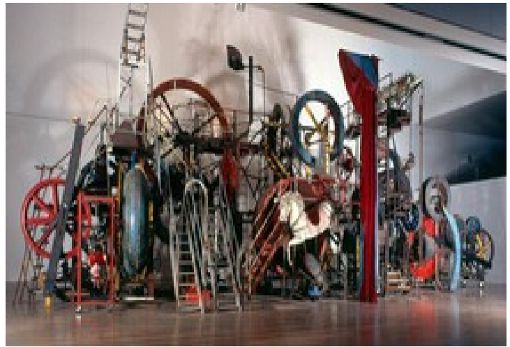
TINGUELY, Grosse Méta Maxi-Maxi Utopia , 1987.