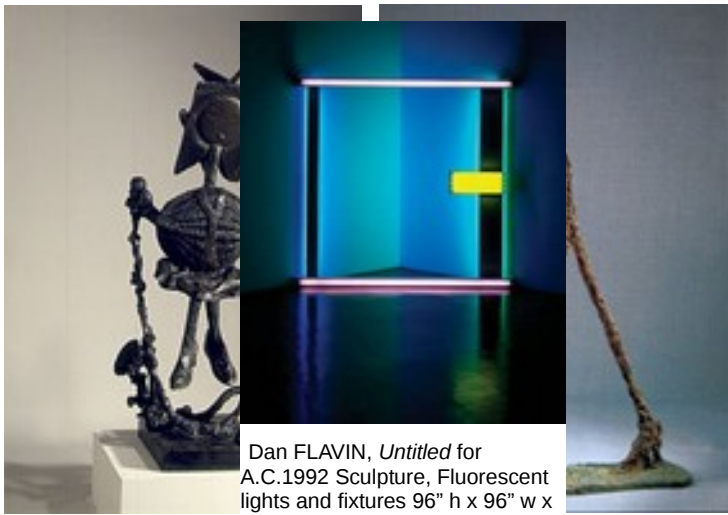
Pablo PICASSO Petite fille avec la corde , 1950.