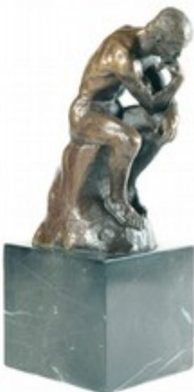
RODIN, Le Penseur , 1880.