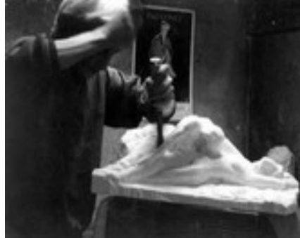
La taille: création d'une sculpture en taille directe sur pierre.