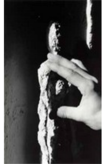
Le modelage: Il peut être réalisé par retrait, par ajout ou par torsion.