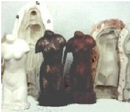
Le moulage: permet de réaliser un ou plusieurs exemplaires (bronze, résine ou plâtre).