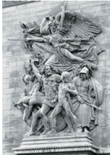
Arc de Triomphe de l'Étoile, haut-relief : la Marseillaise; Rude.