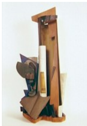
Henri LAURENS, Bouteille et verre , 1918 .