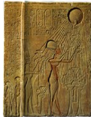
Bas relief (Akhénaton faisant avec sa femme une offrande à Aton).