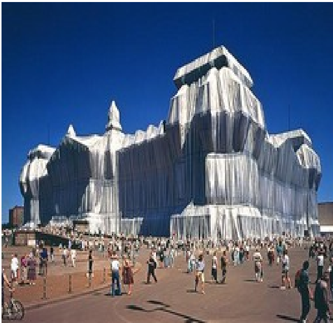
CHRISTO et JEANNE-CLAUDE, Wrapped Reichstag, Berlin , 1971-95, photographie 1995 ;