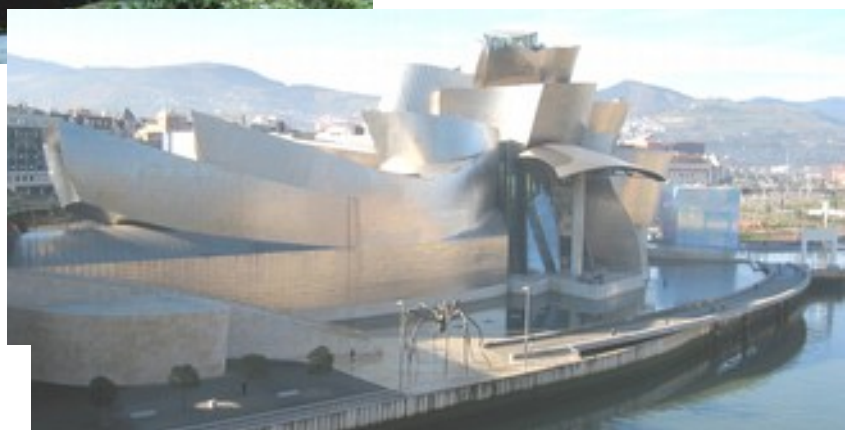
Franck GEHRY, Musée Guggenheim, Bilbao, 1997