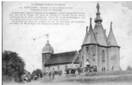
Chapelle Notre Dame du haut, Ronchamp 1843

L'architecte conçoit et organise les espaces en tenant compte des différentes fonctions internes du bâtiment. Il définit une forme, une volumétrie, une ornementation. Il l'inscrit durablement dans son environnement.