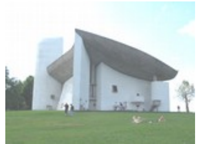
Reconstruction en 1955 par Le CORBUSIER