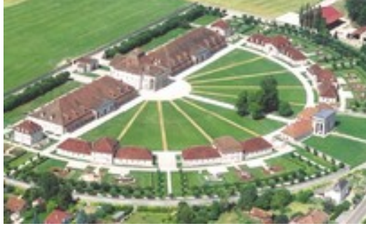
Claude Nicolas LEDOUX les Salines Royales d'arc et Senans,