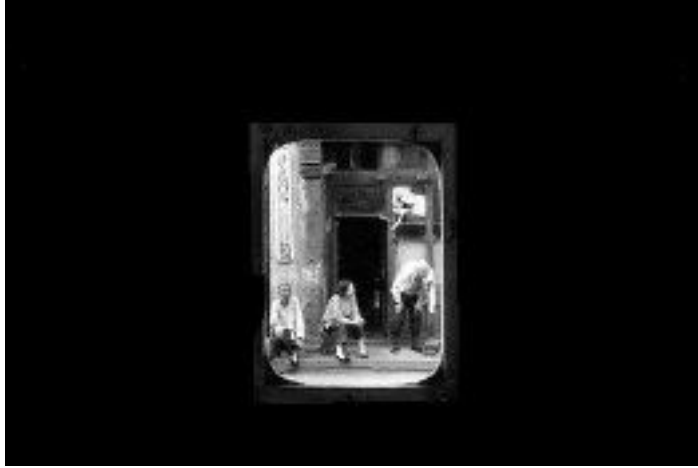
RIBOUD (1923) Fenêtres, Beijing Pékin, 1965