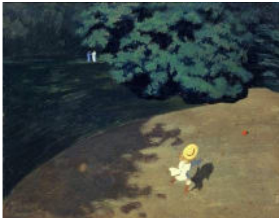
Félix VALLOTTON 1899 Le ballon ou coin du parc avec enfant jouant au ballon, 1899

Les points de vue : On distingue la vue frontale, la plongée, la contre plongée