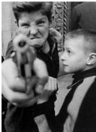
William KLEIN Broadway and