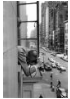
Cartier-Bresson à New York, 1959