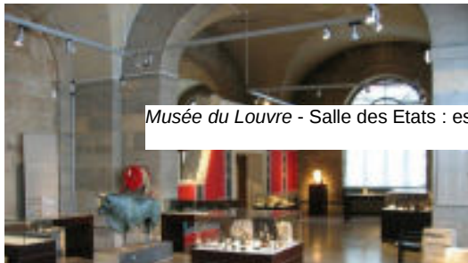
Musée du Louvre - Salle des Etats : espace de présentation de la Joconde / les Noces de Cana Lo

Il s'agit, pour toute scénographie... ...d'accompagner le parcours du visiteur et donc de se poser aussi la question de la place du spectateur.