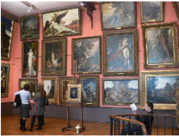
Musée national Gustave MOREAU

Les dispositifs de présentation , c'est-à-dire la manière de mettre en scène les œuvres, ont évolué dans le temps :