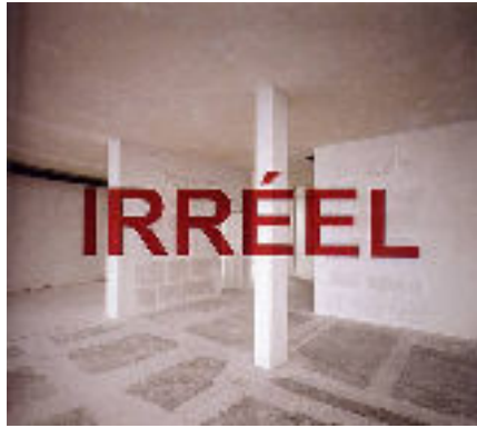
Georges ROUSSE Irréel , G Lawrence WEINER On a String , 2004