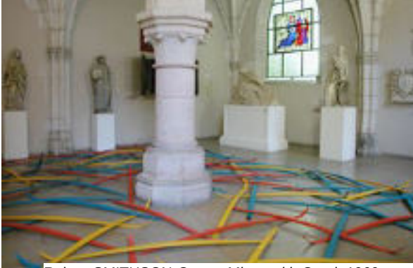
Etienne B Robert SMITHSON Corner Mirror with Coral , 1969 dimensions : .....

L'installation, la performance, la dématérialisation même de l'art conceptuel organisent un questionnement nouveau de l'espace d'exposition et de ses dispositifs.