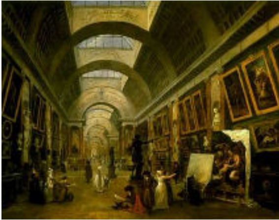
Hubert ROBERT Projet pour éclairer la Galerie du musée du Louvre 1798 huile s/toile

Eclairage directionnel, pièces plongées dans le noir, des projections vidéo ou mises en perspective nouvelles: la lumière est en soi, matériau de l'œuvre.