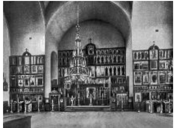
Églis e de l'icône-de-la-Mère-de-Dieu à Saint-Petersbourg.