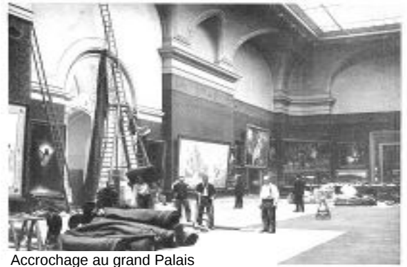
Accrochage au grand Palais

La muséographie consiste à concevoir une exposition : elle définit les techniques de mise en valeur des collections par le choix du mobilier de présentation des œuvres, les modes d'agencement, d' ACCROCHAGE , et d'éclairage des œuvres, les différentes formes de communication (signalétique, multimédias).