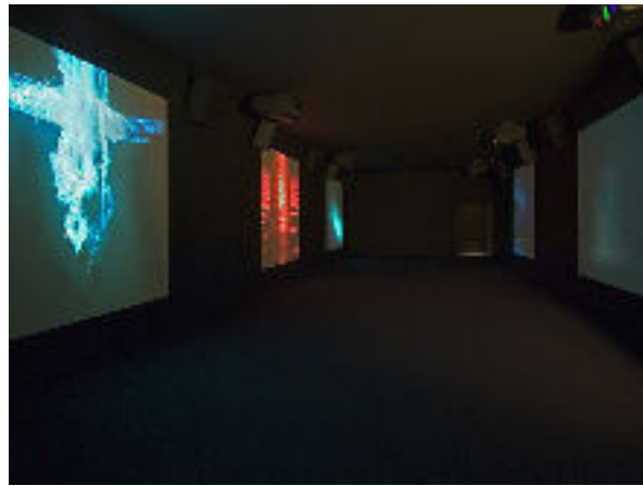
Bill VIOLA Five Angels for the Millennium , 2001 (5 anges pour le millenium), Installation vidéo