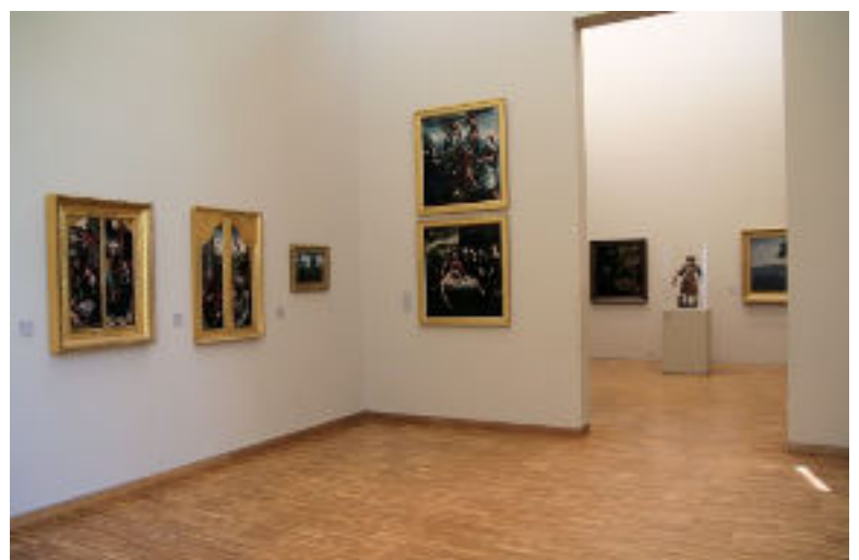
Musée de Grenoble, salles de la Renaissance

Le "cube blanc" de l'époque moderne met en de nouvelles confrontations, dans un espace conçu le plus neutre possible, et qui laisse aussi plus de champ à chaque œuvre.