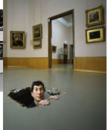
Beaubourg, espaces ouverts / espaces intimes