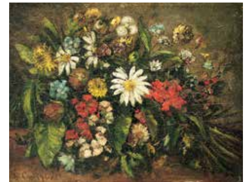
Fleurs , huile sur bois, 1871

Effet de matière : la peinture est travaillée afin de donner du relief