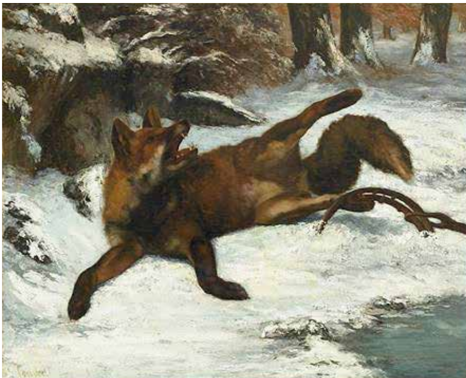
Le renard pris au piège, 1860

Courbet représente souvent des animaux dans ses peintures. Ce sont soit des animaux de compagnie, comme le chien, soit des animaux aidant au transport, comme le cheval, ou encore des animaux sauvages, comme le renard.