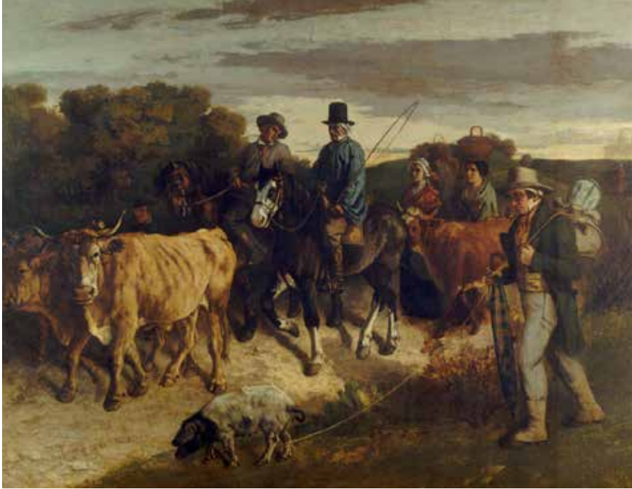
Les paysans de Flagey revenant de la foire, 1850-1855, prêt du Musée des beaux-arts et d'archéologie de Besançon

Les peintures de scène de genre représentent des personnages dans leur vie quotidienne. En voici un exemple : Courbet peint des paysans revenant d'une foire (grand marché).