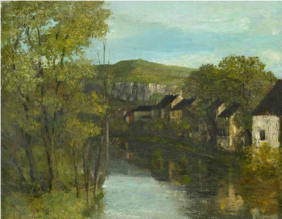
Vue d'Ornans ou le miroir d'Ornans, 1872

Les paysages représentent les 2/3 de la production de Courbet. Le peintre aime beaucoup marcher dans la nature et connaît parfaitement son «pays». Il peint «sur le motif», c'est-à-dire qu'il se rend sur le lieu qu'il veut représenter.