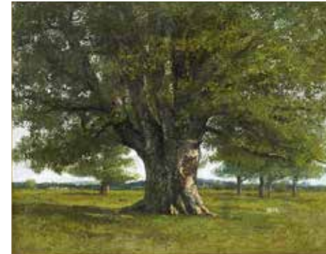
Le chêne de Flagey , huile sur toile, 1864

Voici quelques œuvres de Gustave Courbet, présentes dans le musée.