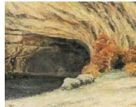
Grotte de la source enneigée , huile sur toile, vers 1866