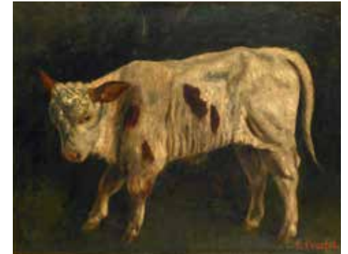
Le veau , huile sur toile, 1873