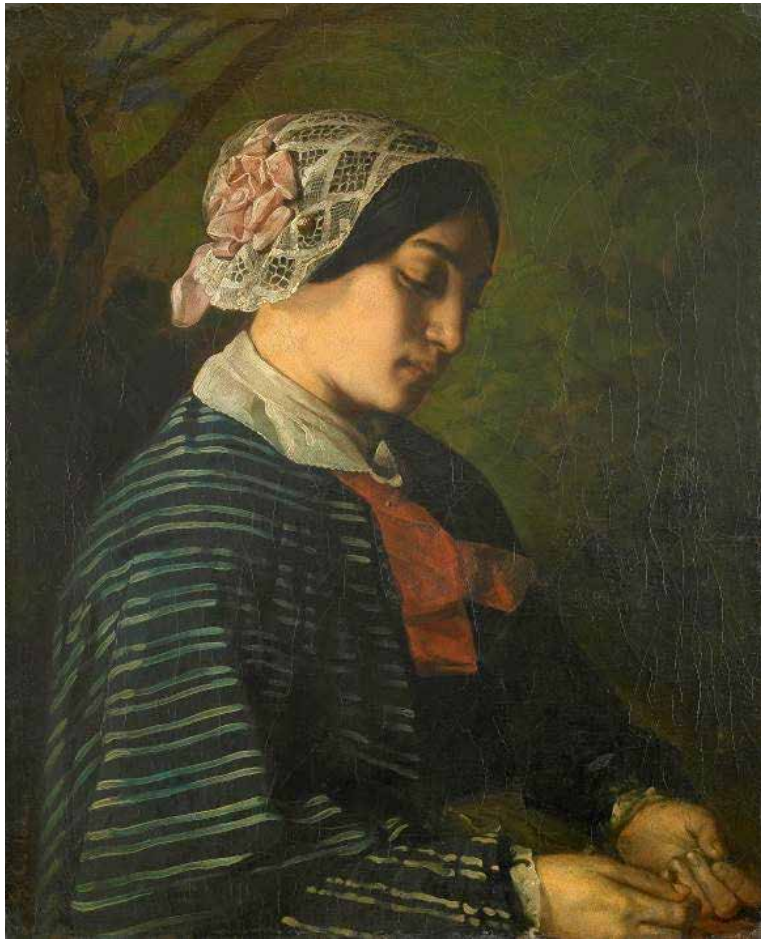
Portrait présumé d'une jeune fille d'Ormans, 1842

Cette peinture est réalisée par Courbet en 1842. Elle témoigne de sa grande maîtrise technique. Pourtant, il n'a que 23 ans !