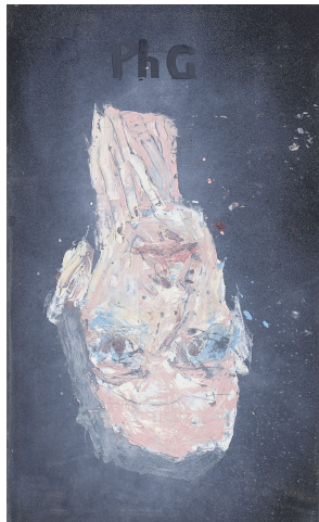
Georg Baselitz, Philip Guston 44 2018, huile sur toile, 164,9x100cm Galerie Gagosian