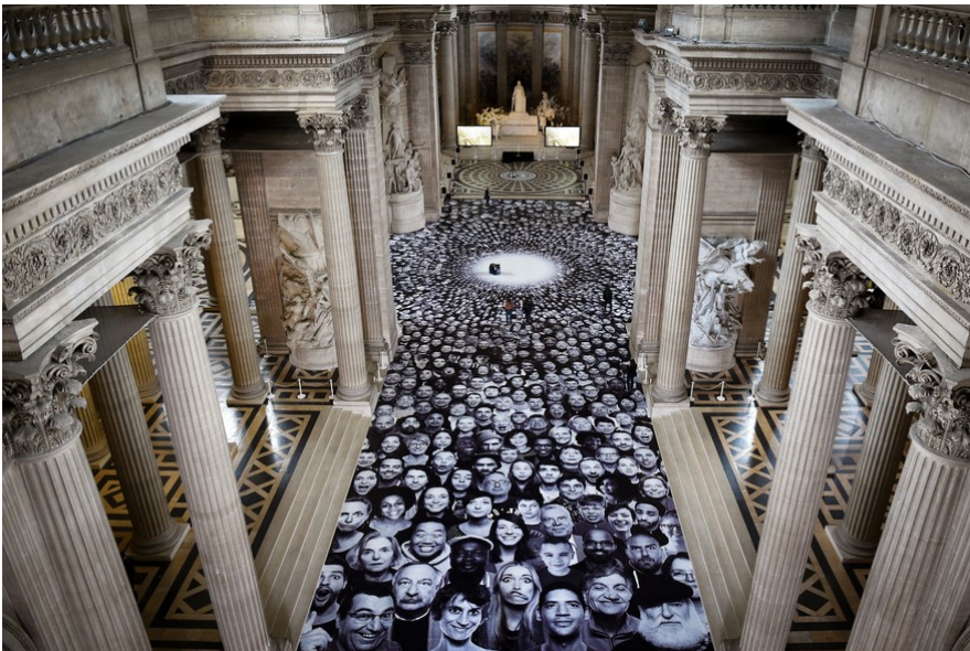
JR, plus de 4000 portraits anonymes au Panthéon, 2014

vocabulaire : installation, sculpture, in situ ?