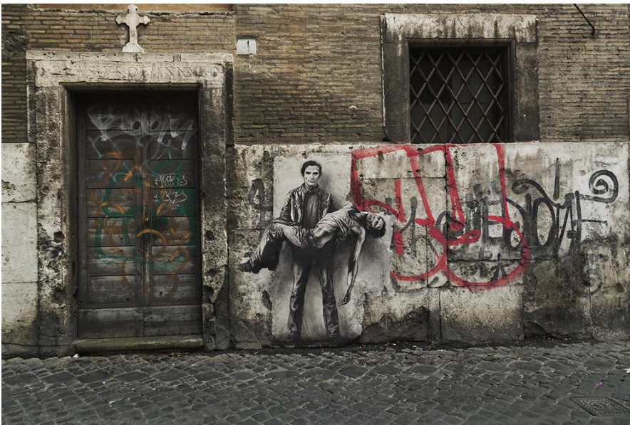
Ernest Pignon Ernest, Portrait de Pasolini Rome, 2015

Autres références : Bill Viola (rapport de l'image au lieu), Chuck Close, Thomas Ruff