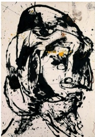
Jackson Pollock, Portrait n°7 1952, émail et huile sur toile 134.9 x 101.6 cm

vocabulaire : geste pictural, trace, matérialité, corps dans/de l'œuvre, posture, expressivité, spontanéité ?