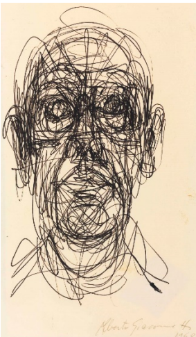
Alberto Giacometti, Tête d'homme 1960, stylo bille noir sur papier Paris, Fondation Giacometti

La verbalisation n'est pas nécessaire puisqu'il s'agit d'une étape d'expérimentation.