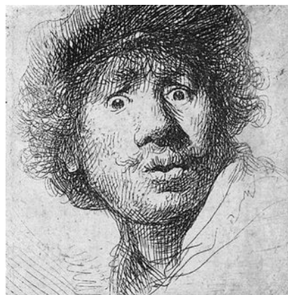
Rembrandt aux yeux hagards (autoportrait) 17 e siècle, gravure à l'eau forte