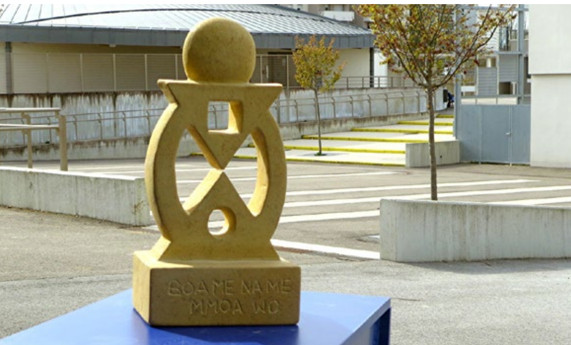
Omar Cham, Boa me name mmoa wo (« Aide-moi et laisse-moi t'aider »), 2017