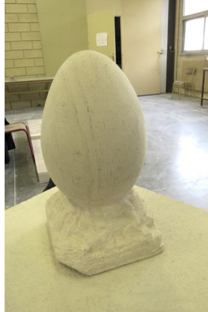
Gérard Arnoux, En lui est la vie, 2018