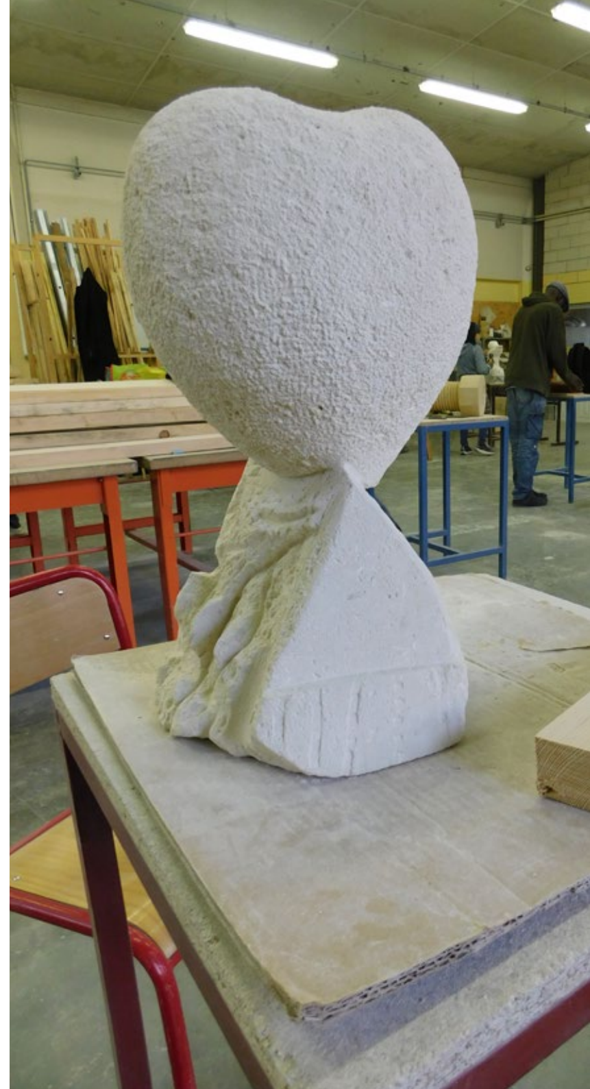
Léna Diars, Le Cœur , 2017