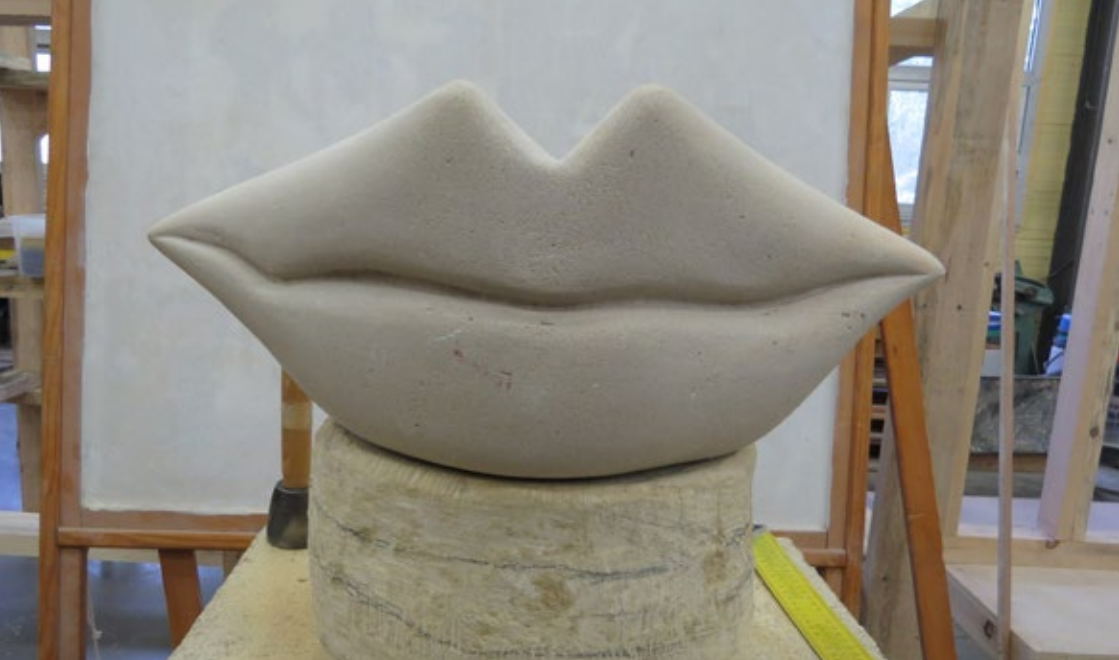
Soléa Daqiq, Le baiser