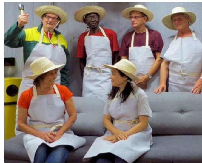
Les sculpteurs réunis pour le spectacle Les planeurs (compagnie Chatha), 2017