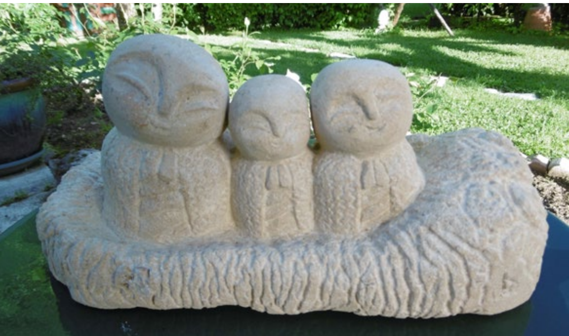
Dominique Lanchere, Tendresses , 2017