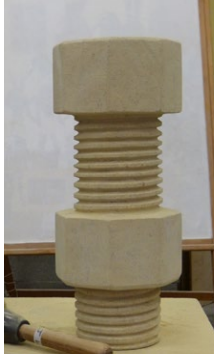
Joël Lequeux, Le boulon, 2017