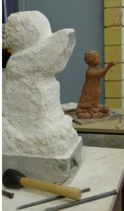
Wei Mazzolini, L'enfant , 2017