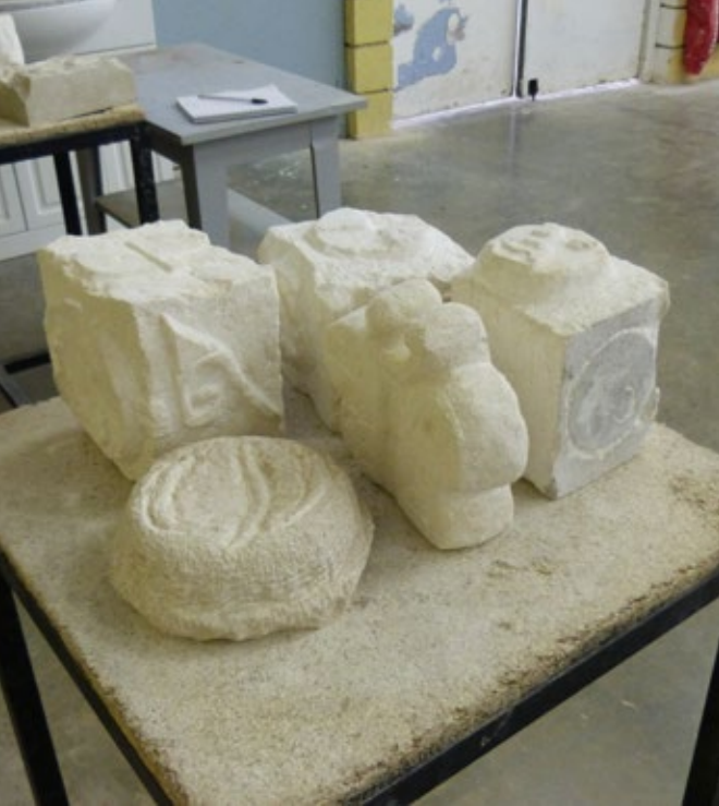
Travaux en cours des collégiens