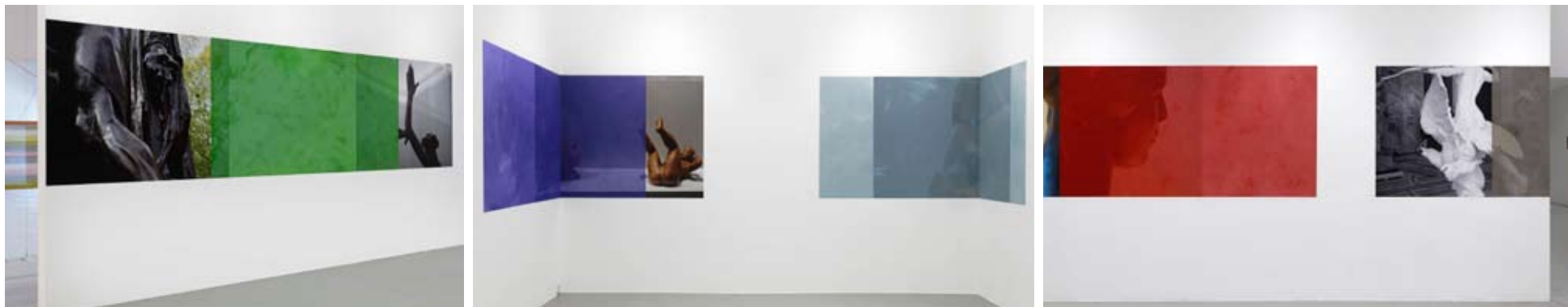
Suite dans les images #3 , 2020

Photographies imprimées sur dos bleu et Tergal « Plein Jour » peint marouflé aux murs. Production Frac Franche-Comté