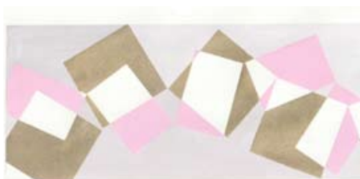
Dessin préparatoire pour Le fantôme de Rose Gold , 2020 © Cécile Bart