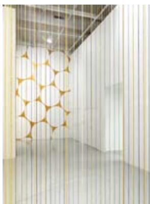
Dentelle, 2020 Pastel à l'huile au mur Production Frac Franche-Comté