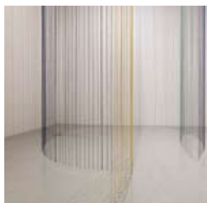
Lisses #15, 2020 Fils de laine et de coton plombés Production Frac Franche-Comté