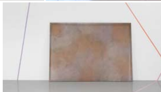
Rose Gold , 2020 Peinture/écran composée de Tergal « Plein Jour » peint et tendu sur châssis aluminium. Production Frac Franche-Comté