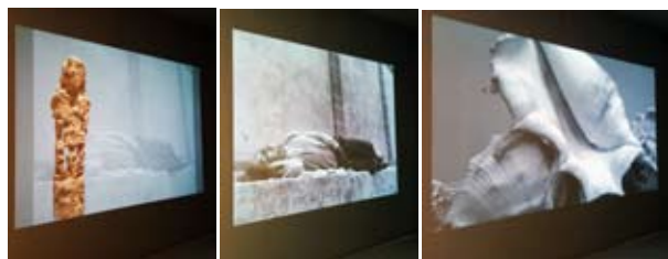
Diaporama #4 , 2020

Cécile Bart nous invite ici, au déplacement et à la variation des points de vue, à appréhender de nouveaux montages visuels et à en faire l'expérience.