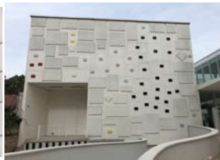
«Bons de déplacement» sur le mur du Consortium après l'installation au Frac Franche-Comté, 2021.