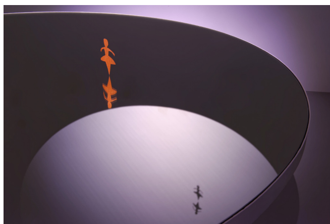
Georgina STARR, The Dancer , 2015 Installation : papier, fil, miroir, bois, lumière. Collection Frac Franche-Comté Acquisition 2017

sculpture danse reflet minimalisme point de vue INSTALLATION pantomime corps flottement solitaire LENTEUR MOUVEMENT monochromie espace