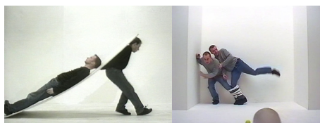
WOOD & HARRISON, Selected Tapes , 1993/1998 Vidéo couleur et son, 37 min. Collection Centre Pompidou, Paris