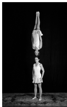
AGNÈS GEOFFRAY Des équilibres III 2019 Photographie noir et blanc Galerie Maubert, Paris