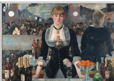
Edouard Manet, Un bar aux Folies Bergère , 1881-1882, peinture à l'huile, 96x130cm, Institut Courtauld, Londres