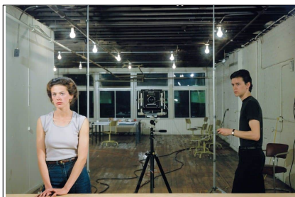
Jeff Wall, Picture for women , 1979, Deux épreuves cibachromes transparentes jointes bord à bord et caisson lumineux, 161,5 x 223,5 x 28,5 cm, Musée National d'Art Moderne, Paris