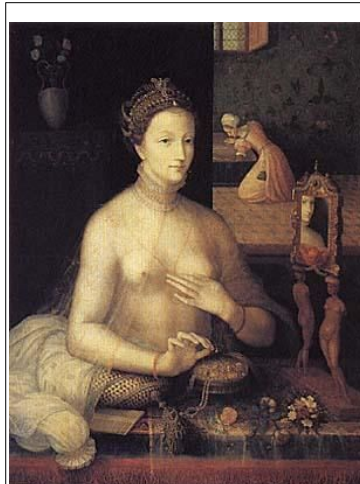
François Clouet, Diane de Poitiers à sa toilette , 1559, Musée Condé