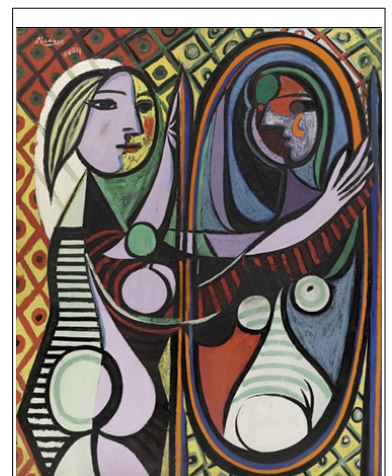
Pablo Picasso, Jeune femme au miroir , 1932, huile sur toile, 162,3 x 130,2 cm, New York, MOMA