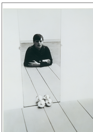
Florence Henri, Selfportrait , 1928, gelatin silver print, 39,3 x 25,5 cm, Staatliche Museen, Berlin