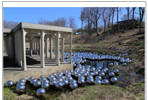
Yayoi Kusama, Narcissus Garden , installation, 1300 sphères en acier inoxydable sur bassin, Biennale de Venise, 1966