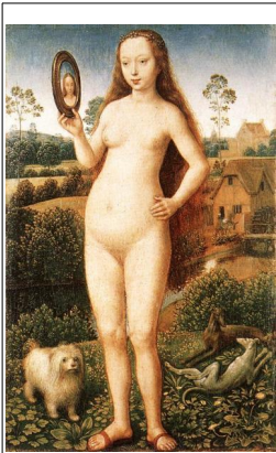
Hans Memling, La Vanité – extrait du Polyptyque de la Vanité terrestre et de la Rédemption céleste , Musée des Beaux-Arts, Strasbourg, peinture à l'huile sur bois, 1485