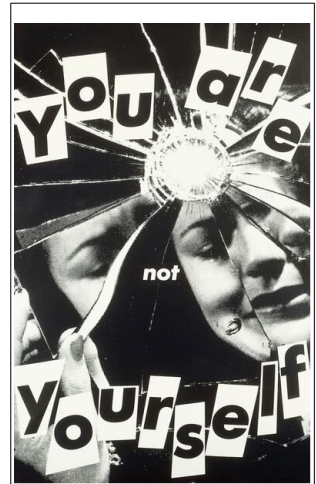
Barbara Kruger, You are not yourself , photomontage, Hirshhorn Museum de Washington, 1981