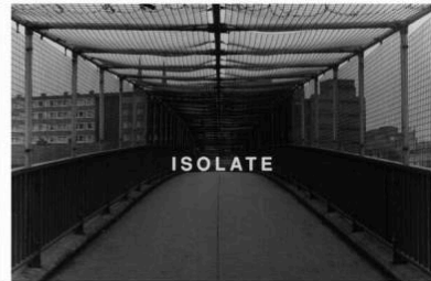
Willie Doherty, Strategy : Sever/Isolate (Stratégie : couper/isoler) , 1989, 2 photographies en noir et blanc montées sur aluminium, Diptyque.