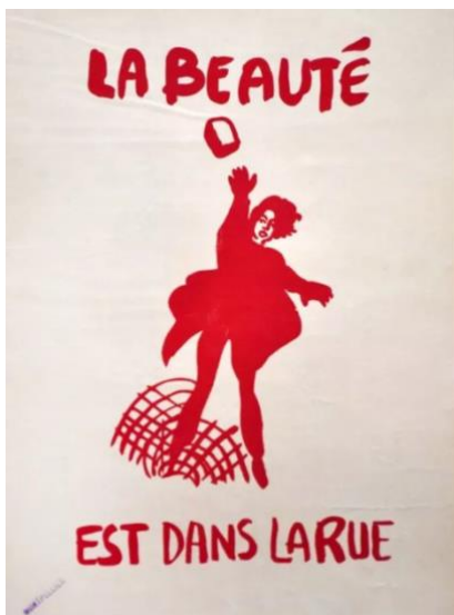
Où est la beauté ? Anonyme La beauté est dans la rue Affiche de mai 68