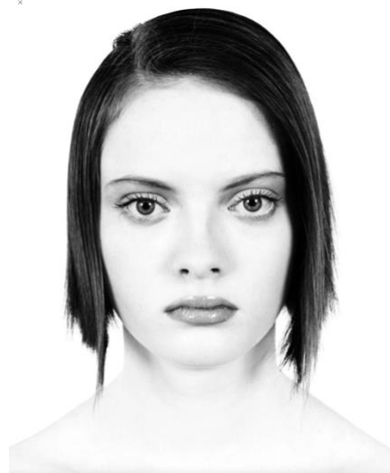
Beauté inquiétante Valérie Belin, sans titre, 2001, n°011003, tiré de la série Modèles I , 161x125 cm