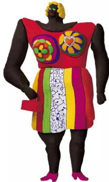
Rejet des modèles imposés Niki de saint Phalle Dolorès , 1966-1995 Résine peinte, grillage Sprengel Museum, Hanovre, Allemagne