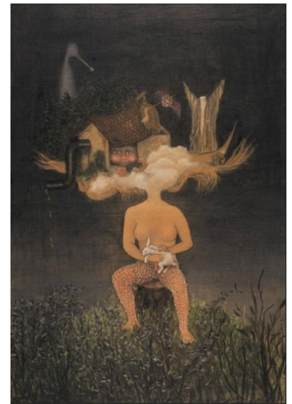
Les innombrables visages de la beauté Meret Oppenheim Les innombrables visages de la beauté , 1942