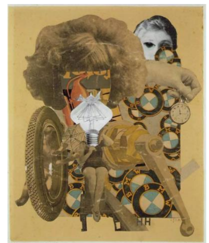
Beauté-trophée, femme-objet Hannah Höch Das schöne Mädchen (The Beautiful Girl - La Jolie fille) , 1919-1920 Photomontage et collage, 35 X 29 cm.