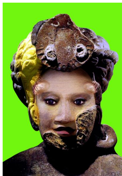
Défiguration - Refiguration ORLAN, Défiguration-Refiguration, Self-hybridations précolombienne n° 35 , 1998 Cibachrome collé sur aluminium, 120 x 150 cm