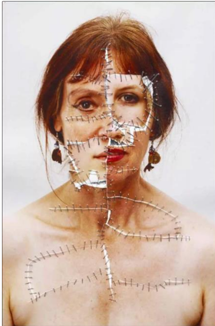
Vieillesse Annegret Soltau Geteiltes Selbst , 2019 Photographies cousues