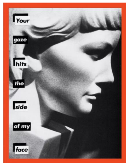
Regards insistants Barbara Kruger Untitled (Your Gaze Hits the Side of My Face) , 1981 Courtesy of the artist and Sprüth Mager