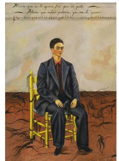
Refus des attributs de la féminité Frida Kahlo Autopportrait aux cheveux coupés , 1940