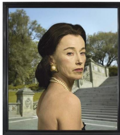
Jeunesse simulée, rides dissimulées Cindy Sherman, Untitled #465 (« Society Portraits », 2008).