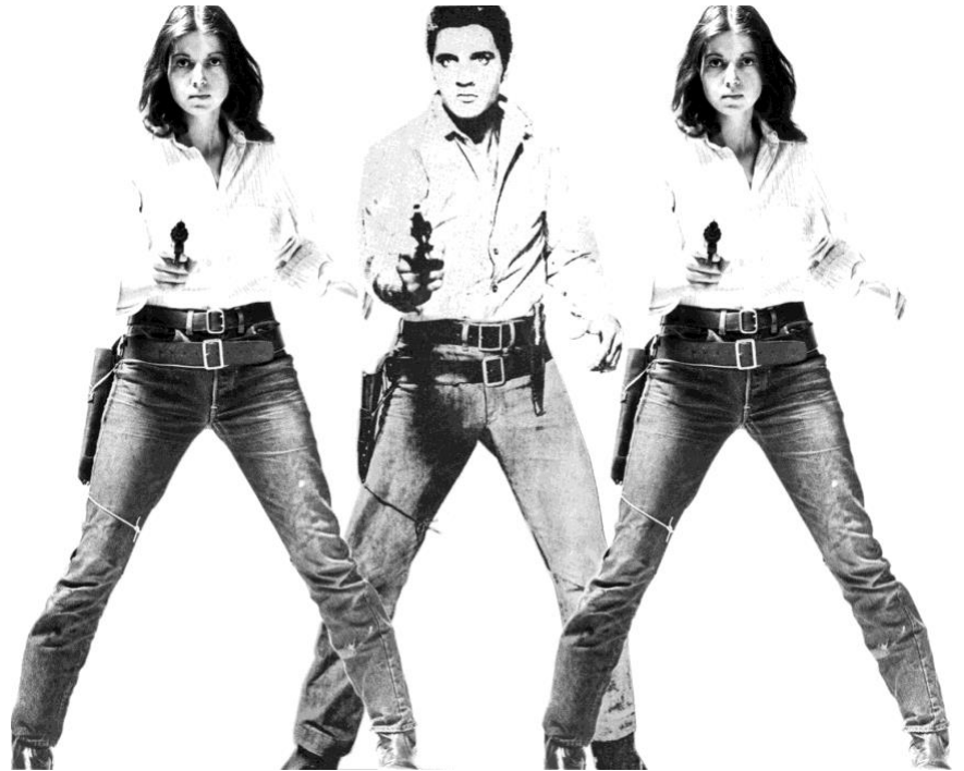
Ulrike Rosenbach Art is a criminal action No. 4 , 1969-70 Photomontage noir et blanc et feutre sur papier baryté, 23,7 x 31 cm © The Sammlung Verbund collection, © ADAGP, Paris

Martha Rosler déplorait déjà, au milieu des années 1960, avec Woman with Vacuum , la marginalisation des femmes en représentant une femme passant l'aspirateur dans un couloir aux murs couverts d'œuvres évoquant le Pop Art.