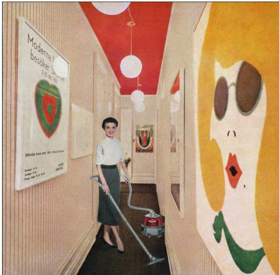
Martha Rosler Woman with Vacuum or Vacuuming Pop Art (serie Body Beautiful, or Beauty Knows No Pain), 1966– 1972 Photomontage

Martha Rosler déplorait déjà, au milieu des années 1960, avec Woman with Vacuum , la marginalisation des femmes en représentant une femme passant l'aspirateur dans un couloir aux murs couverts d'œuvres évoquant le Pop Art.