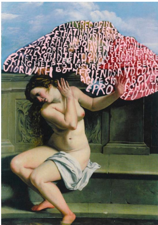
Betty Tompkins Apologia (Artemesia Gentileschi #4) , 2018 Acrylique sur papier, 27,9 x 21,6 cm Coll. Brooklyn Museum

Son œuvre est avant tout une tentative de compréhension de sa position en tant que femme dans la société. Pour cela, elle étudie les rôles et les représentations attribués aux femmes dans l'art et dans la collectivité, en intégrant à son travail des personnages féminins universels.