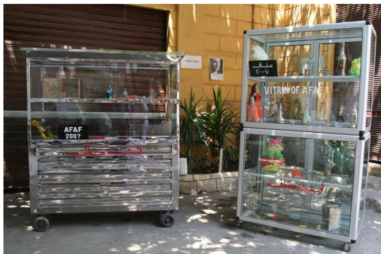
Susan Hefuna (1962, Egypte) Vitrines of Afaf , 2007 Œuvre en 3 dimensions, verre, métal, élastomère, objets divers Centre Pompidou, Paris

Agnès Thurnauer questionne l'histoire de l'art avec ses douze "portraits grandeur nature". Réduisant les portraits à des noms sur des badges géants, elle féminise le nom de célèbres artistes iconiques de l'art contemporain.