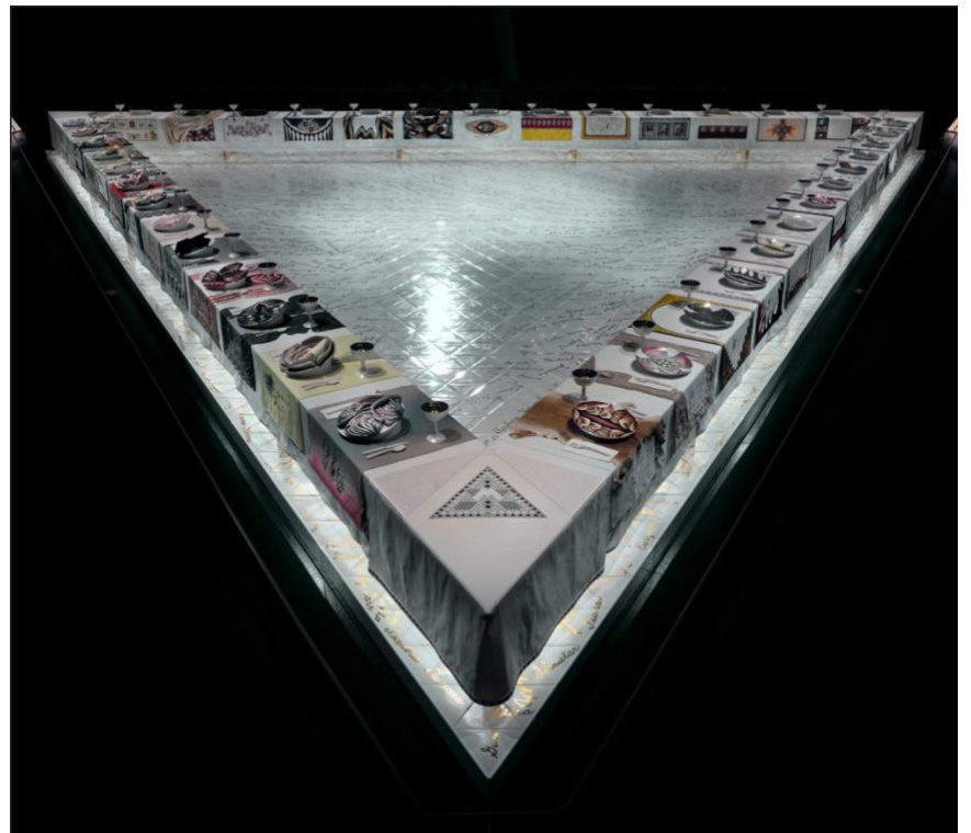
Judy Chicago The Dinner Party , 1979 Coll. Brooklyn Museum, Gift of the Elizabeth A Sackler Foundation

Des pages arrachées dans des livres d'histoire de l'art, encadrées avec application, détournent des grands classiques de la peinture et de la photographie. Des mots roses en lettres capitales voilent les sujets principaux des tableaux reproduits : des excuses publiques d'artistes, notamment le peintre Chuck Close et le chanteur R. Kelly, accusés respectivement de harcèlement et d'abus sexuels. La série s'intitule ironiquement « Apologia » (« apologie » en français, proche du mot apologies, qui signifie « excuses ») et fait aussi la part belle aux artistes femmes.