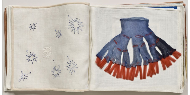
Louise Bourgeois, Sans titre, no. 9 sur 34 , extrait du livre illustré, « Ode à l'Oubli », 2004, tissus, 27x34cm, New-York, Museum of Modern Art.