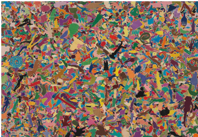
Alighiero Boetti, Tutto (Tout) , 1987, broderie à la main sur lin, 174x251cm, Paris, Centre Pompidou.

+ HDA cycle 4, thématique 7 : L'émancipation de la femme artiste.