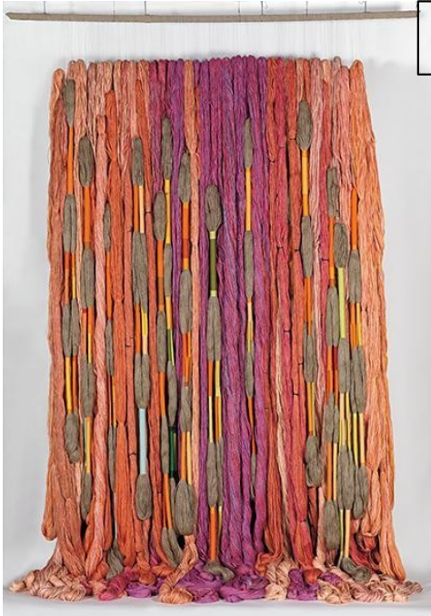
Sheila Hicks, Lianes de Beauvais , 2011-2012, installation, lin, coton perlé, laine, soie et nylon, dimensions variables h. 200/250cm, Paris, Centre Pompidou.