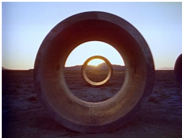
Nancy Holt, Sun tunnels , 1978, film 16 mm transféré sur vidéo, couleur et son, durée : 26'31", Metz, Frac Lorraine. (film rendant compte d'une œuvre de Land Art).