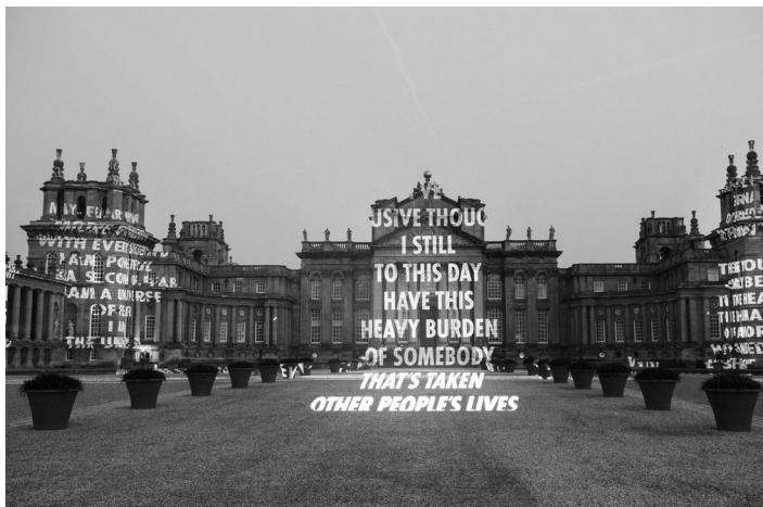
Jenny Holzer, On War (A propos de la guerre) , 2017, Projection, Blenheim Palace, Royaume-Uni, collection de l'artiste.

La présence matérielle de l'œuvre dans l'espace, la présentation de l'œuvre : le rapport d'échelle, l'in-situ, les dispositifs de présentation, la dimension éphémère, l'espace public ; l'exploration des présentations des productions plastiques et des œuvres ; l'architecture.