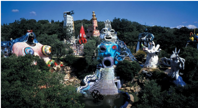
Niki de Saint Phalle, Vue d'ensemble du Jardin des Tarots , 1978 et 1993, Pescia Fiorentina, Italie.